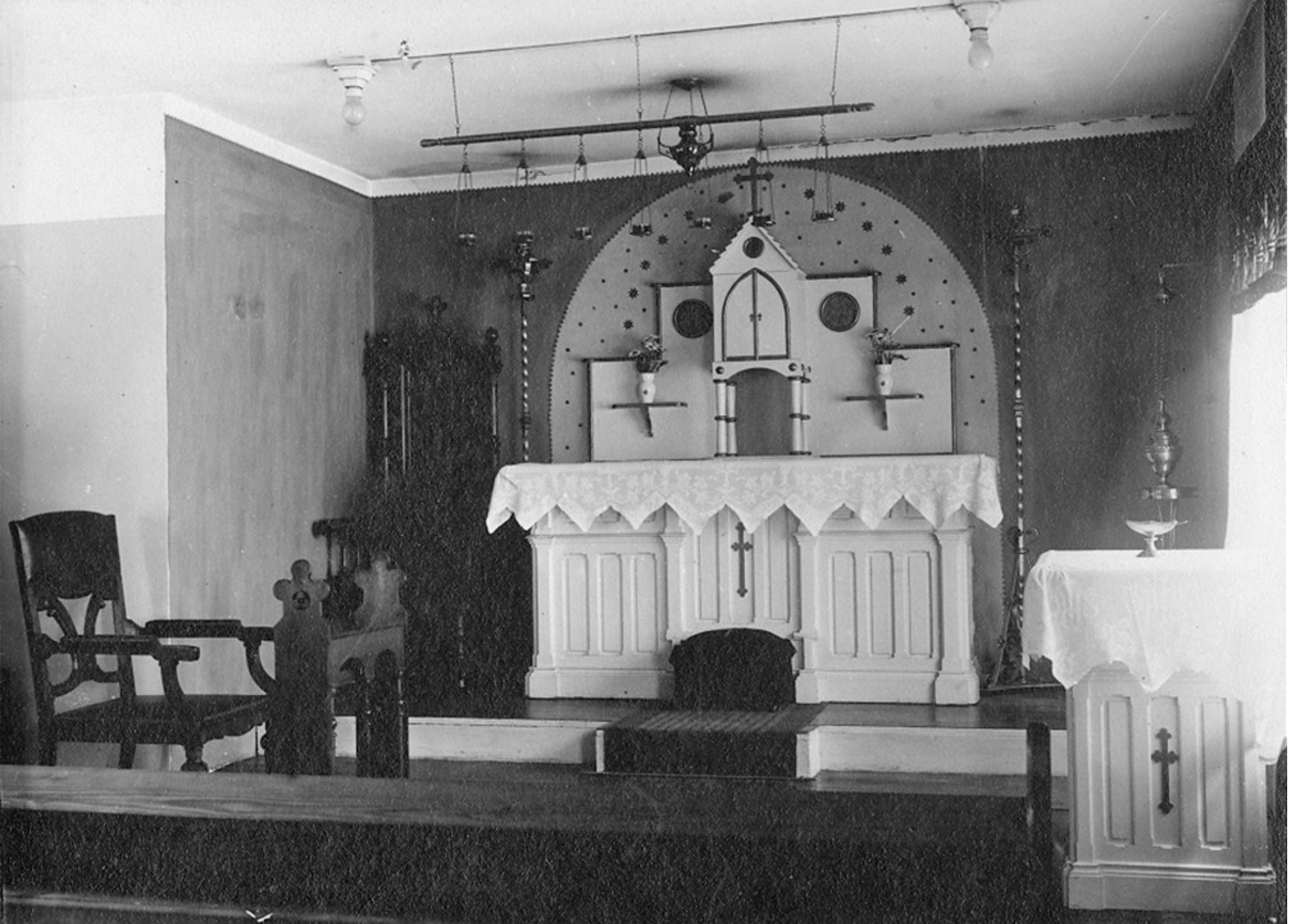
„Oekumenisch-apostolische Kapelle in Hamburg, Bürgerweide Nr. 62“, ca. 1935.