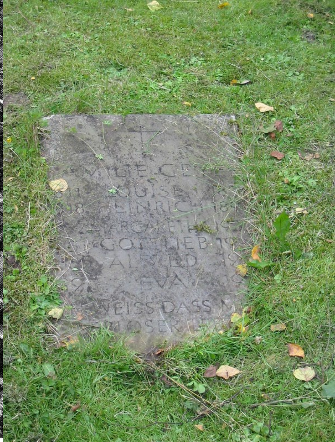
Früheres und derzeitiges Grabmal von Heinrich Geyer auf dem Ohlsdorfer Friedhof.